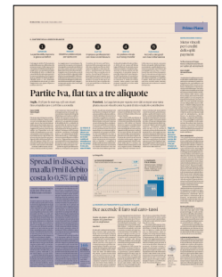
Peso: 1-1%, 3-13%

Dell'emissione di ieri di 2i rete gas per un titolo a 7 anni, collocato a 57 centesimi sotto il BTp. Telefonica se l'è «cavata» con uno spread sul midswap di 95