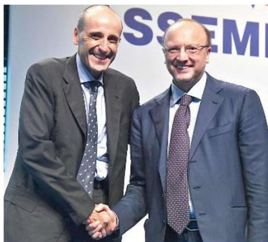
PRESIDENTI Alberto Vacchi e Vincenzo Boccia si stringono la mano durante l'edizione 2017 di Farete alla fiera di Bologna

I numeri di Farete 2018: 30mila metri quadrati di stand; 800 aziende coinvolte; oltre 90 workshop tematici in programma; 112 operatori internazionali provenienti da 31 Paesi (Afghanistan, Albania, Algeria, Armenia, Brasile, Cambogia, Cina, Danimarca, Emirati Arabi Uniti, Francia, Filippine, Germania, Iran, Giordania, Indonesia, Oman, Irlanda, Kuwait, Macedonia, Myanmar, Norvegia, Svezia, Pakistan, Polonia, Regno Unito, Serbia, Stati Uniti, Sud Africa, Thailandia, Tunisia e Turchia) per un totale di oltre 1.150 appuntamenti b2b.