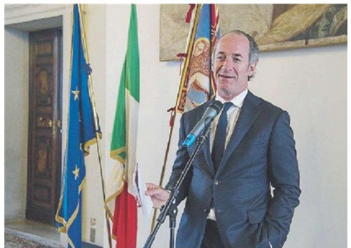
A FAVORE Il presidente della Regione Veneto, Luca Zaia