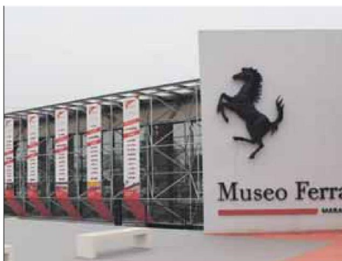
Dall'alto, in senso orario, l'ingresso del Museo Ferrari, l'interno di quello di Carpigiani e un particolare della collezione Fisogni